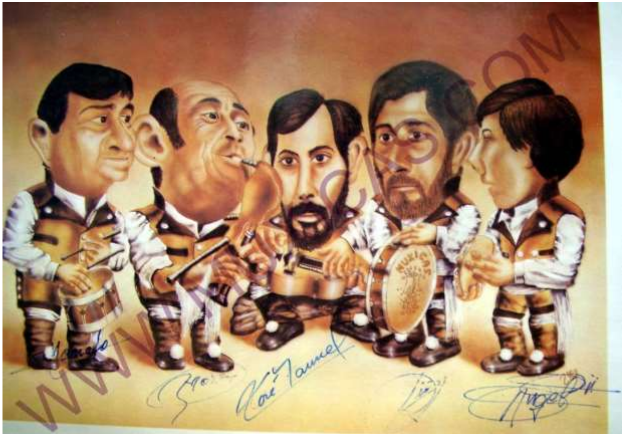
Detalle da portada do segundo disco de Muxicas asinada por todos. O debuxo orixinal consérvase no noso poder.